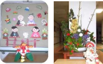
明けましておめでとうございます