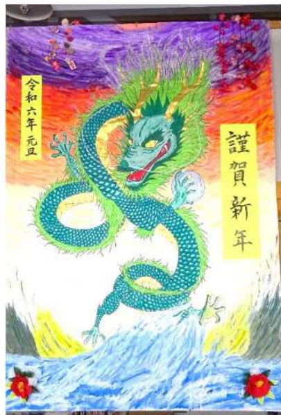
1月の壁画「海から飛び出した龍」