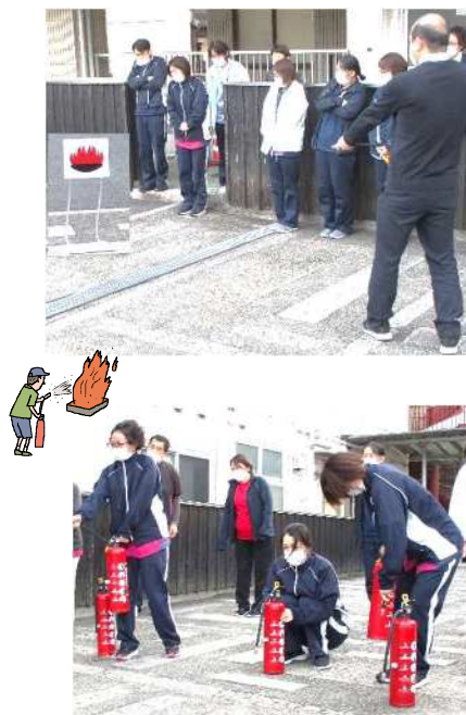
1年に2回防災訓練を実施しています。今回は水害時の対応と模擬消火器による消火訓練を行いました。